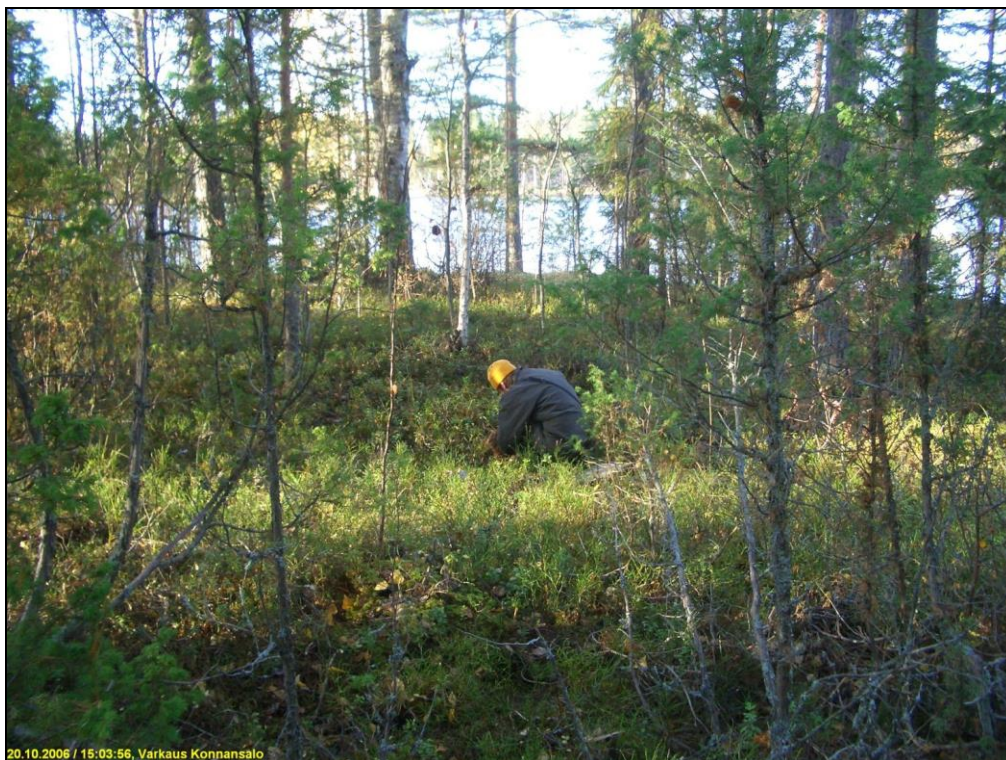
Timo Sepänmaa tutkii painanteeseen tehtyä koekuoppaa. Kuvattu pohjois-koilliseen.

Huomiot: Paikalla on niemen kärjessä laakea tasanne, kärkinipukan ollessa kalliota. Maaperä paikalla on hiekkainen moreeni, paikoin kallio on lähellä maanpintaa. Niemen lakitasanteen itäosassa on laakea matala painanne, kooltaan n. 5 x 7 m. Painanteeseen tehdyssä koekuopassa havaittiin vahva lika-nokimaakerros, jossa palaneen luun murusia, sekä palaneita kiviä. Ympäristön tehdyissä muissa koekuopissa (n. 7 kpl) ei havaittu mitään esihistoriaan viittaavaa. Paikalla vaikuttaa olevan suppea-alainen rauta- tai varhaismetallikautinen asuin- tai leiripaikka. Paikan rajaus on arvio.