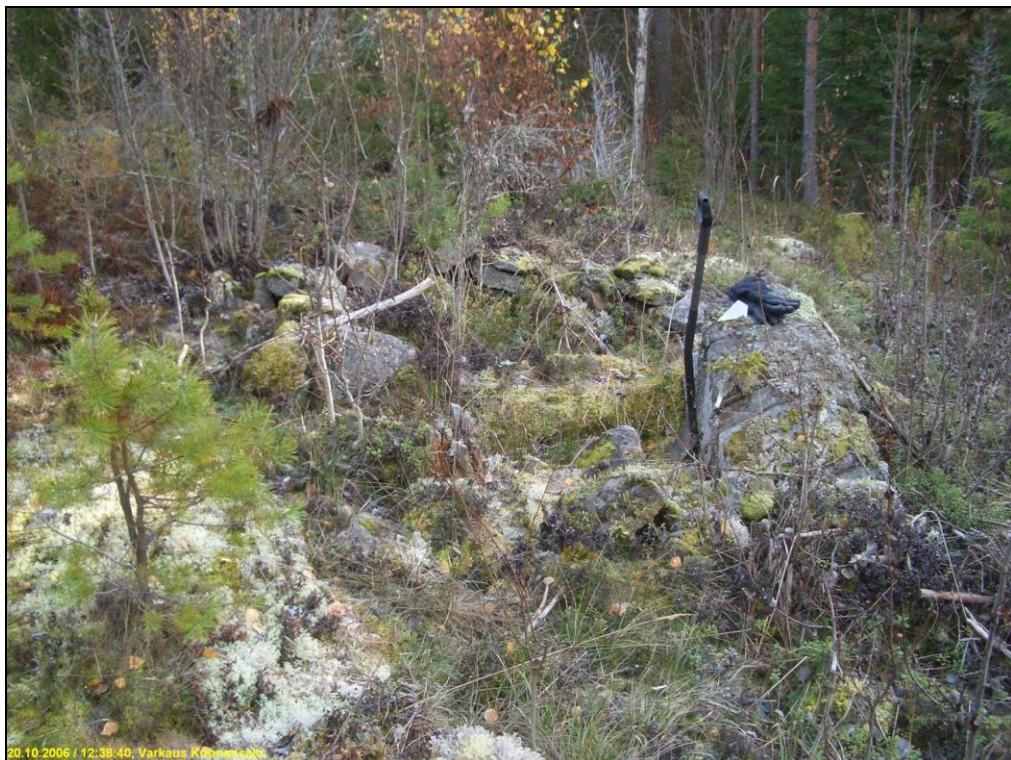
Kivirakennetta, kuvattu etelään.

Huomiot: Paikalla on avokalliolla kivirakenne, joka on suorakaiteenmuotoinen, kooltaan n. 2,5 x 2 m. Se on koottu pään kokoisista moreenikivistä. Sen sisällä on myös kiveystä, mutta reunoja matalammalla ja ne vaikuttivat muodostavan sisälle rakenteen. Rannanpuoleisella sivulla rakenteen nurkassa on muuta kiveystä isompi maakivi. Kivirakennelma vaikuttaa lapinrauniolta - sen pohjalta osin puretulta tai "täyttämättömältä" lapinrauniolta. Aivan varmasti sitä ei voi kuitenkaan lapinraunioksi todeta. Kyseessä on kuitenkin muinaisjännös ellei sitä voida tarkemmin kivaustutkimuksin muuksi todeta.