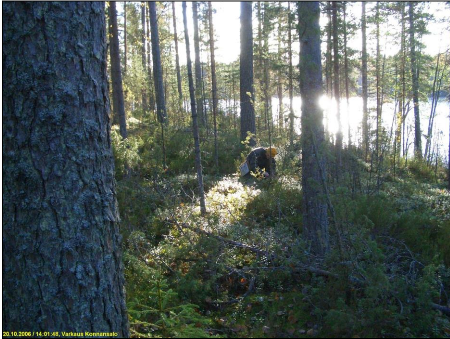
Asuinpaikkaa kuvattuna etelään. Timo Sepänmaa tutkii koekuoppaa. Alla asuinpaikkaa kuvattuna länteen.