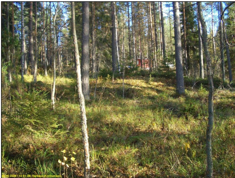
Asuinpaikka on kuvan keskellä auringonpaisteen kohdalla olevan matalan kallion päällä. Kuvattu itään.