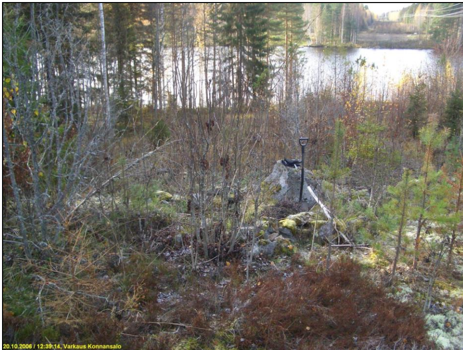
Kivirakenne pusikossa kallion päällä (lapio siinä pystyssä). Kuvattu länteen, alla pohjoisen