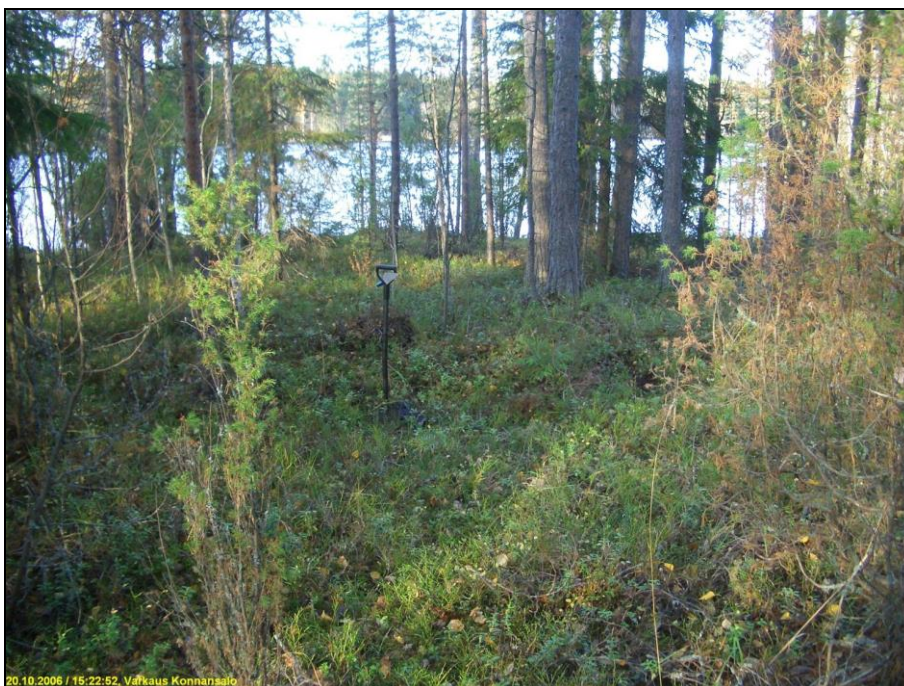
Asuinpaikkaa kuvan etualalla. Lapiro löytökoekuopan kohdalla. Kuvattu pohjoiseen, alla kuvattu kaakkoon.