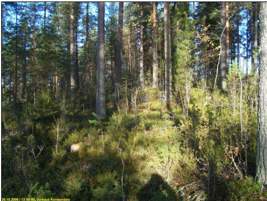
Asuinpaikkaa kuvattuna pohjoiseen.

Huomiot: Paikalla on rantaan jyrkästi laskeva rinne, jonka laella on hiekkainen tasanne, jonka takana maasto nousee vielä mutta loivemmin. Tasanteen koillispuolella on avokalliota ja eteläpuolella ohuen maakerroksen ja sammaleen peittämää kalliota. Paikalla havaittiin muutamassa koekuopassa vahva n. 10-20 cm paksu kulttuuri- maakerros, jossa on runsaasti palanutta luuta pieninä murusina. Paikan rajausta on topografian ja koekuoppien perusteella arvioitu ja sen tarkkuus on n. ±10 m. Paikka on sijoitettu koordinaatistoon gps:n avulla n. ±6 m tarkkudella.