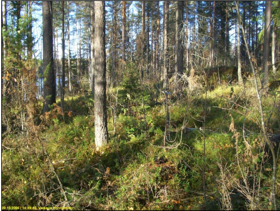
Asuinpaikkaa kuvattuna pohjoiseen.